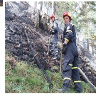
podieľa sa na likvidácii ohnisk

Fyzická osoba je povinná: dodržiavať vyznačené zákazy a plniť príkazy a pokyny týkajúce sa ochrany pred požiarmi, dodržiavať zásady protipožiarnej bezpečnosti pri činnostiach spojených so zvýšeným nebezpečenstvom vzniku požiaru alebo v čase zvýšeného nebezpečenstva vzniku požiaru, oznámiť bez zbytočného odkladu príslušnému okresnému riaditeľstvu hasičského a záchranného zboru požiar, ktorý vznikol v objektoch, priestoroch alebo na veciach v jej vlastníctve, zabezpečovať pravidelné čistenie a kontrolu komínov, dodržiavať pri manipulácii s horľavými látkami a horenie podporujúcimi látkami požiadavky na protipožiarnu bezpečnosť, umožniť orgánom štátneho požiarneho dozoru vykonávanie potrebných úkonov pri zisťovaní príčin vzniku požiarov, zabezpečovať plnenie opatrení v súvislosti s ochranou lesov pred požiarmi.