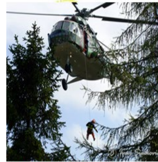
vykonáva záchranu osôb ohrozených požiarom