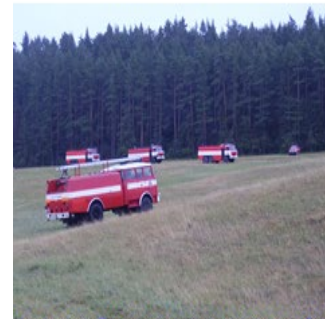
zabezpečuje dostatok hasiacej látky